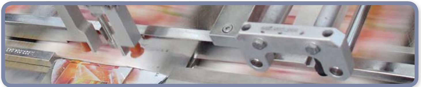
Druck "CD Label / Booklet / Inlay"